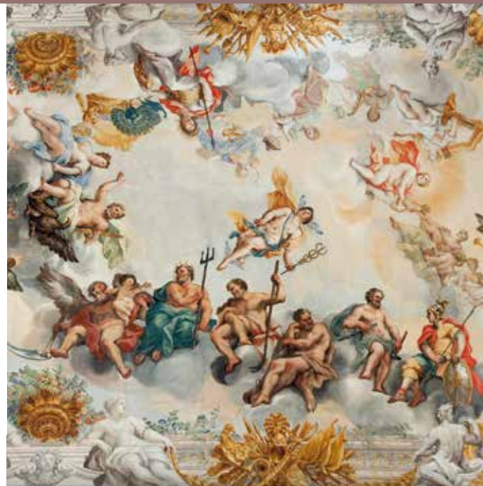
Nozze di Bacco e Arianna, Macerata, Musei civici Palazzo Buonaccorsi

Studi sulla poesia e la fortuna di un autore latino indelebilis